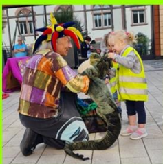
Der Drache Dreihorn erzählte den Kindern vom Planeten der Fantasie