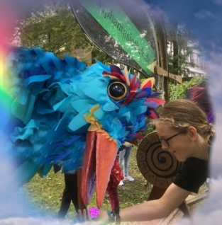
Kinder lieben den riesigen Friedensvogel