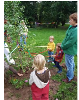
Kinder und Eltern bei der Friedensbaumpflanzung