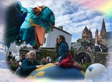
Der Friedensvogel besuchte auch den Jahrmarkt der Sinne im Bischofsgarten