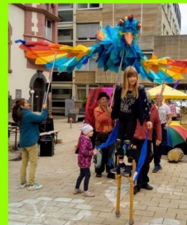
Der Friedensvogel spannte seine 5 Meter großen Flügel auf und zog vor der Stelzenkarawane durch Limburg