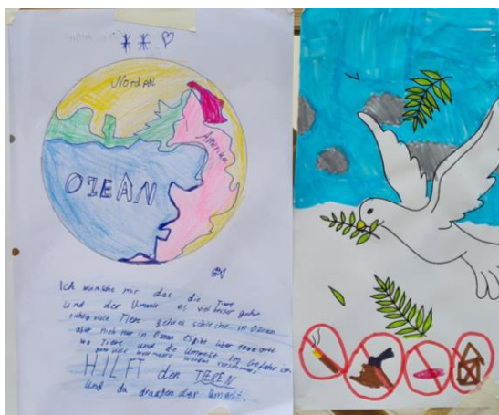
Am Wünschmal konnten die Kinder auch ihre Herzenswünsche für die Welt malen und aufschreiben