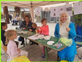
Am Zukunftstand bauten die Kinder ihren Zukunftsplaneten