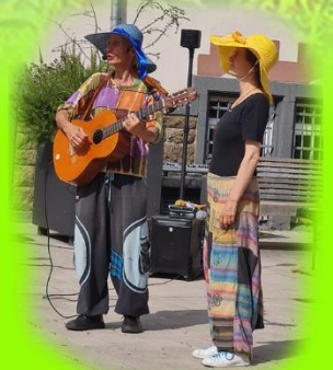
Das Duo Herzwind lud zum Mitsingen und Mitklatschen ein