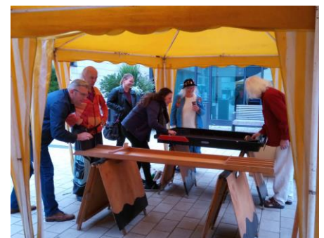
Auch der Bürgermeister und andere Erwachsene erinnerten sich wieder daran, wie gut es tut, einfach zu spielen.

Die erste Friedensvogel-Kreativwoche war ein toller Anfangserfolg, und es werden schon bald weitere Aktionen folgen. Ziel ist, den Friedensvogel und die Stelzenkarawane in der Region als Modellprojekt für kreative Nachhaltigkeit und Friedensarbeit zu etablieren und damit Kindern eine starke Stimme für ihre Welt von morgen zu geben. Um ein noch breiteres Zusammenwirken mit Kitas, Schulen, Kulturschaffenden und anderen Institutionen der Region zu erreichen, plant das Friedensvogel-Team in Kooperation mit dem Limburger Jugendamt und der Unterstützung des Bürgermeisters ein baldiges virtuelles Vernetzungs-Treffen und freut sich auf viele kreative Kontakte. Für weitere Projekte werden schon jetzt kleine und große Mitwirkende gesucht! Das Friedensvogel-Team freut sich auf zukünftige Stelzentänzer*innen, Musiker*innen, Künstler*innen, Organisator*innen usw. Mehr Infos unter www.friedensvogel.de