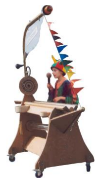
Eines der Phantasiothek-Spielgeräte: