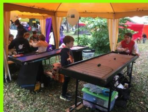
Der Phantasiothek-Spielepark wurde intensiv bespielt