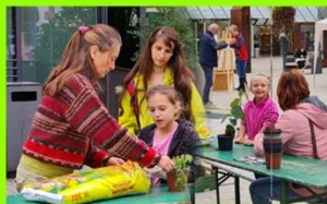
Hier pflanzten die Kinder kleine Friedensbäume zum mit nach Hause nehmen...