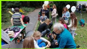
Stelzen anziehen und ausprobieren beim Stelzen-Workshop. Geübte bereiteten sich sogar auf einen Einsatz bei der Stelzenkarawane vor