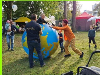
Begeistert schlossen die Kinder beim Erdballspiel Freundschaft mit dem blauen Planeten